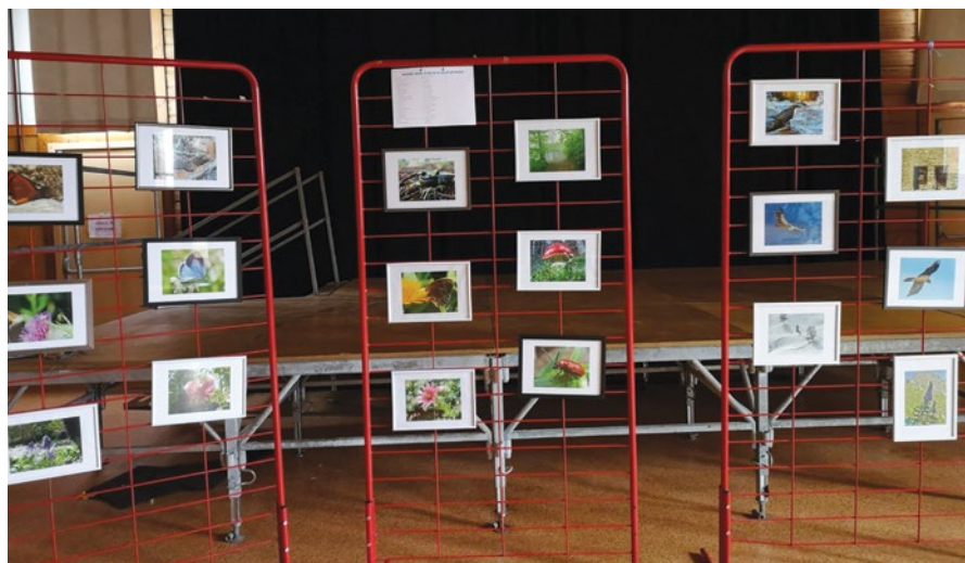
Exposition de photos à la Maisou d'Amount