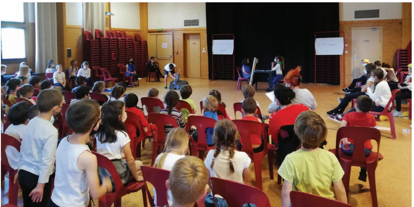
Représentation des CE2-CM devant leurs camarades de maternelle et de CP-CE1

Les projets et actions de l'ALAE s'inscrivent dans le grand projet de l'école basé sur le recyclage, décoration du composteur, récupération et recyclage d'objets, afin de réaliser des statues pour décorer le grillage de la cour.