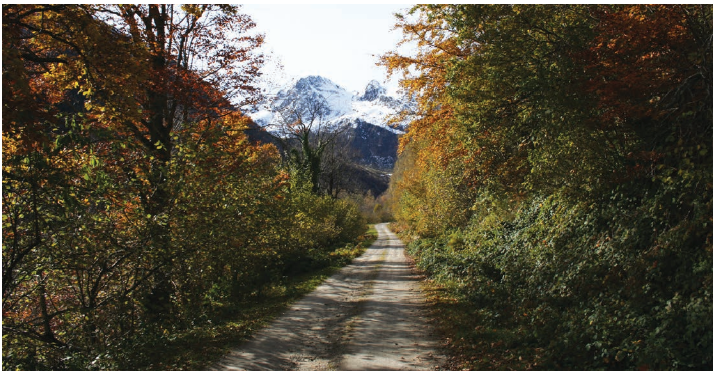
Le sentier de Sauzet

Profitez de notre belle vallée en parcourant ces itinéraires.