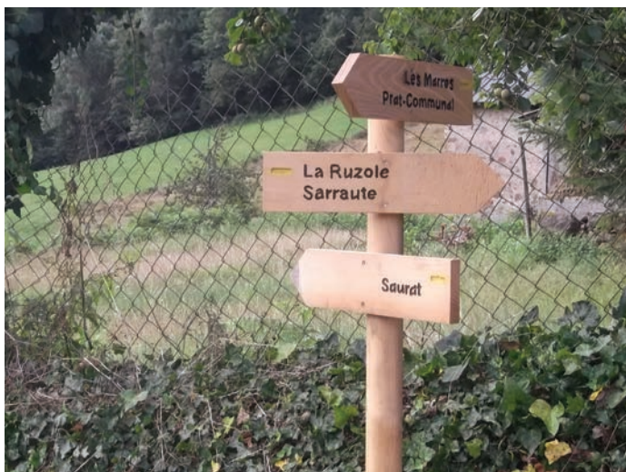
Un des panneaux réalisés par les bénévoles