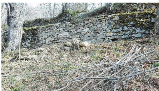
Mur du lieu-dit « Mathieu »

Le mur de soutènement du chemin communal, au lieu-dit « Mathieu », était partiellement éboulé rendant le passage très délicat sur cette portion de chemin. Les agents de la commune ont réalisé les travaux avec l'aide d'un employé de la commune de Bédéilhac. La mutualisation des moyens techniques et humains, entre villages de montagne, est très utile et favorise la solidarité.