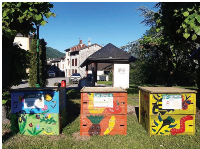
Les bacs de compostage décorés par les enfants

Pour autant, nous souhaitons renforcer nos efforts et avons déjà en tête d'autres projets et des améliorations à porter à ces premières actions (par exemple : broyage plus visible dans un lieu plus accessible, plus de bénévoles pour son organisation, une communication plus ciblée...).